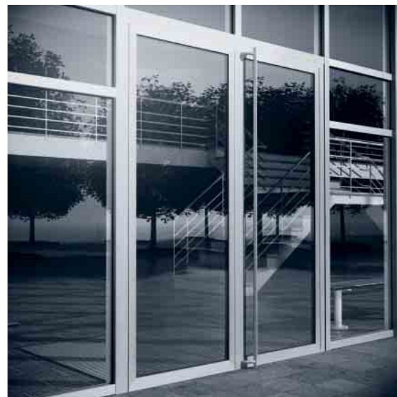
Schüco Tür ADS 75.SI HD Schüco Door ADS 75.SI HD