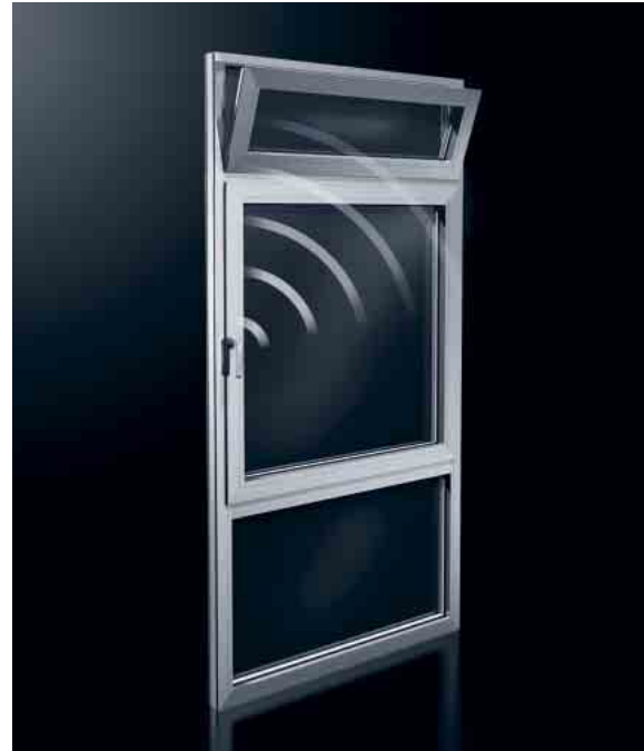
Schüco AvanTec Funkgriff: komfortable Oberlicht-Bedienung Schüco AvanTec radio-controlled handle: Convenient toplight operation